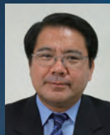
寶 馨 防災研究所 教授

気候、人口動態、国際関係など自然的・社会的条件が急激に変わりつつある。それに伴って災害の形態も変容している。こうした実態を概観しつつ、今後数十年われわれ地球社会に生きるものは、何を考えどう行動すべきであるかを述べる。これまでに生じてきた自然災害現象と近年の特徴、もたらされた被害、様々な防災・減災の方策や今後のあり方を述べ、地球社会の調和ある共存に向けた大学の貢献と研究所の意義について語る。