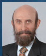
カール・ベッカー こころの未来研究センター 教授

20世紀は、西洋の理想と哲学の究極的表象と見なしてよいかもしれない。謂わば「文明国」が自然と「未開民族」を支配しようと試み、その限界まで押し進められた世紀であった。しかし21世紀では、その近代西洋啓蒙主義と人間中心主義の非永続性が広く認められ、大いに批判される時代となりつつある。本発表は、日本が抱える環境問題等を確認した上、近代西洋世界観の限界を明らかにし、その代換と成り得る日本の伝統的思想の応用と将来性を探る。